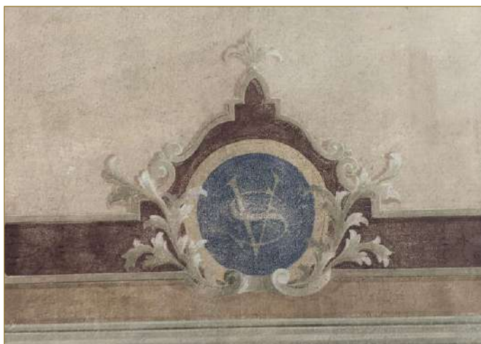
Sala di attesa della stazione di Mira: particolare decorazione soffitto