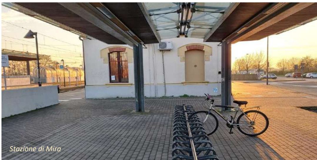
Stazione di Mira

Anche se i programmi di gestione del servizio viaggiatori non sono riconducibili al gestore dell'infrastruttura, Infrastrutture Venete Srl onde consentire altre modalità di trasporto, mette a disposizione all'interno della propria pertinenza di stazioni e fermate, ove possibile, spazi che consentano la movimentazione/sosta di mezzi sostitutivi del servizio ferroviario e per l'interscambio con altre modalità utilizzate dal Viaggiatore.