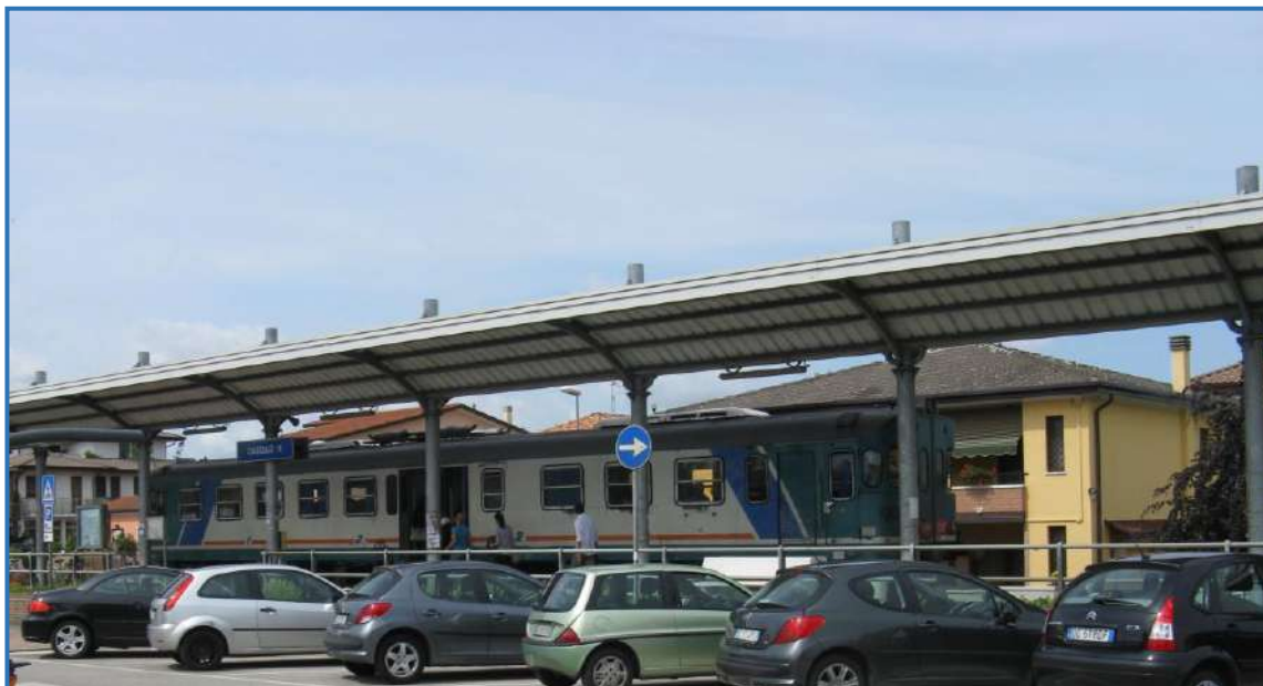
Fermata di Casello 11 (Calcroci di Camponogara)

(2) Possibilità di parcheggio libero di auto, moto e biciclette in prossimità della stazione o nelle immediate vicinanze (200/300 mt.)