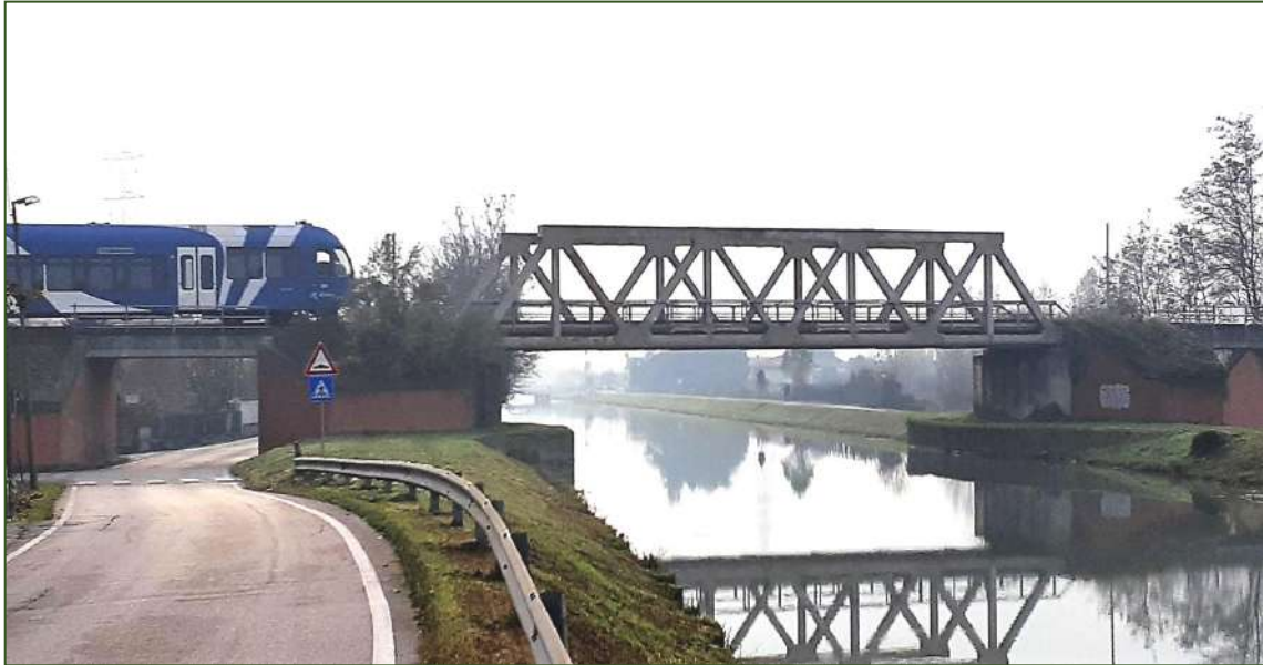
Comune di Mira – Ponte sul fiume Novissimo