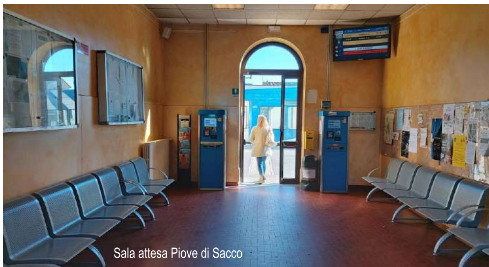
Sala attesa Piove di Sacco

(3) Sottopasso momentaneamente non accessibile