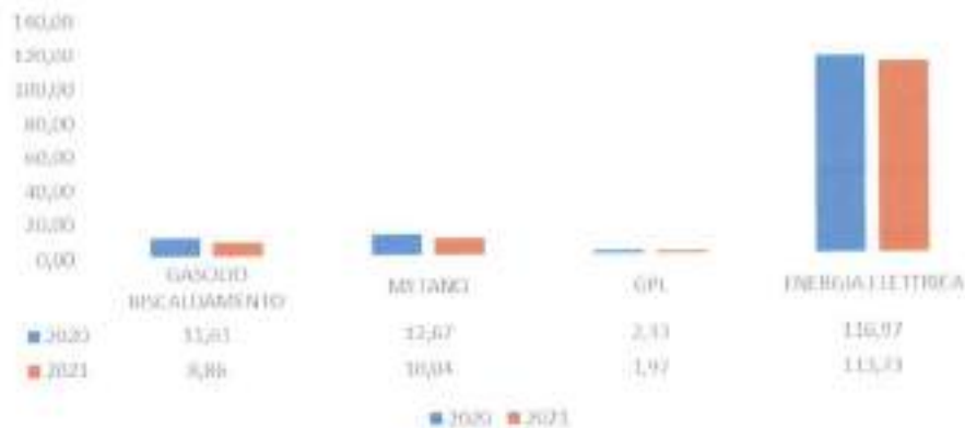
Confronto consumi energetici UNI 2020-2021 [tep]

Dai dati raccolti, si può quindi attestare che la riduzione dei consumi energetici del comparto navigazione interna nell'anno 2021 rispetto all'anno 2020 è stata del 6,25% (riduzione consumo totale da 143,57 tep a 134,59 tep) con una riduzione dei consumi evidente in ogni vettore energetico.